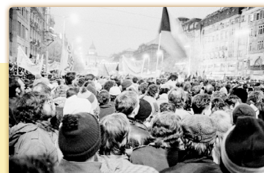
demonstace (Václavské náměstí)

Zlomovým okamžikem pádu komunistického režimu u nás se stal 17. listopad 1989 . Po vzpomínkové akci, konané v Praze k uctění památky 50. výročí obětí z roku 1939, se část demonstrujících studentů vydala do centra města. Cestu jim však zatarasila policie. Proti demonstrantům s květinami a svíčkami nasadila speciální policejní jednotky s obušky, obrněné transportéry a vodní děla . Mnoho studentů bylo zraněno.